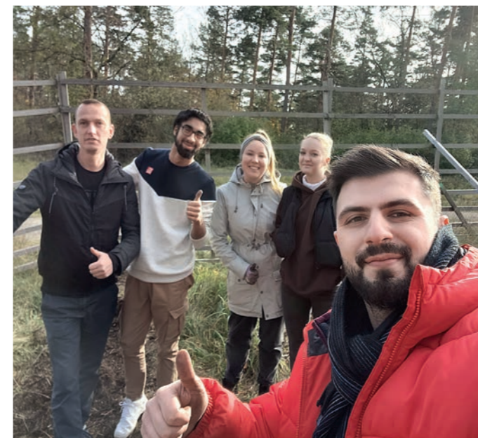
Auszubildende sowie junge Kollegen pflanzen Bäume auf dem Cospoth in Jena.

Unserem Versprechen, für jedes neu eröffnete „Konto mit Zukunft“ einen Baum zu pflanzen, folgten Taten: Für 740