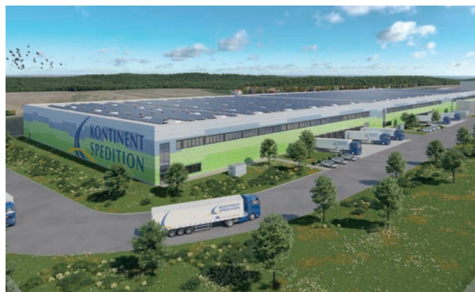
In Bollberg wird ein neues Logistikzentrum gebaut.